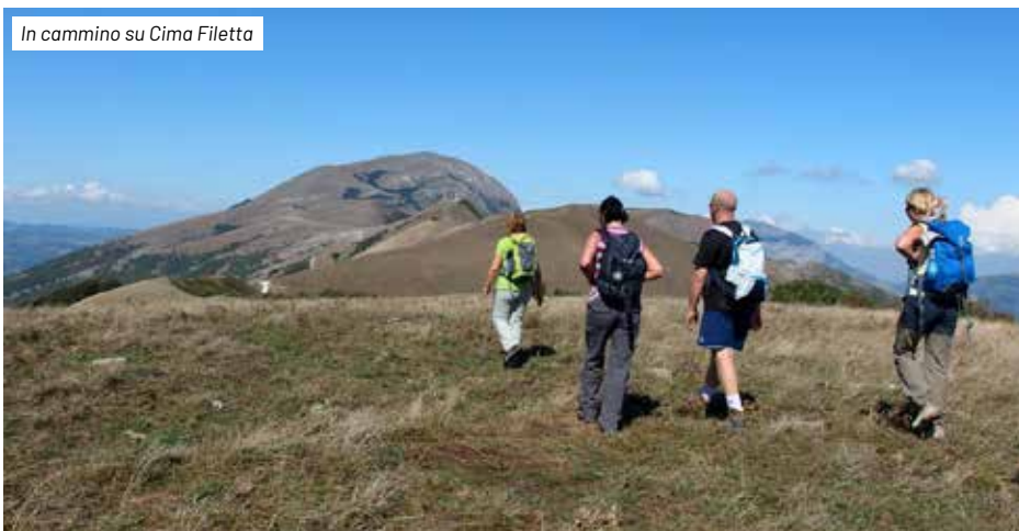
In cammino su Cima Filetta

re che proprio in questo luogo, a cavallo tra l'Umbria e le Marche, secondo alcuni storici, sorgeva l'originaria sede dell'Abbazia di S. Maria d'Appennino, testimonianza della fervida vocazione al monachesimo diffusa in tutto il territorio del Parco. Il sentiero continua con piccoli saliscendi entrando in territorio marchigiano, prosegue quindi per prati-pascoli ricchi di straordinarie fioriture, passando nei pressi de La Sforcatura, da dove arriva il sentiero 286. Poi esso aggira verso est la cima del monte della Rocca, fino a giungere nei pressi del Passo di Chiaromonte (892 m), luogo strategico e di importanza storica, in quanto punto di incontro tra Umbri e Piceni e punto di snodo dell'antico Diverticulum ab Helvillo-Anconam. Da qui si comincia decisamente a salire lungo una ripida cresta fino al Sasso Grande (1030 m), su pascoli aridi e magri adatti all'attecchimento di calcatrepolo ( Eryngium amethystinum ), carlina ( Carlina acaulis ), vedovella ( Globularia meridionalis ). Sul versante occidentale del monte della Rocca, di particolare interesse è la presenza di uno degli ultimi lembi di bosco di lecci. D'ora in poi il sentiero corre sul confine tra Umbria e Marche, in direzione nord-nordest,