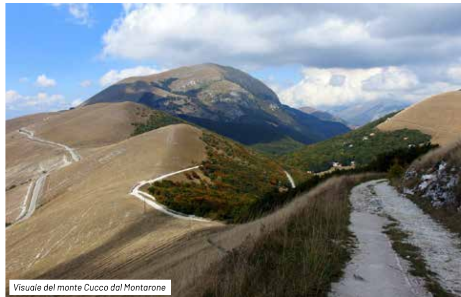
Visuale del monte Cucco dal Montarone

lungo i crinali dei monti e delle valli di questo tratto dell'Appennino Umbro-marchigiano, regalandoci ancora splendide viste panoramiche su entrambi i versanti.