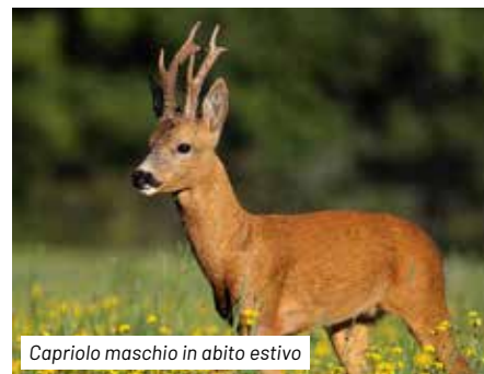
Capriolo maschio in abito estivo

L'intero percorso, soprattutto in primavera ed in estate, è un giardino naturale, dove vivono fiori dai colori intensi e vivaci, talora rari e leggendari come le bellissime orchidee ( Dactyloriza sambucina , Orchis mascula , Orchis simia ed altre), mentre intorno antichi boschi di faggi degradano verso il basso in boschi misti di carpino nero ( Ostrya carpinifolia ), orniello ( Fraxinus ornus ) e cerro sui versanti più freschi, e roverelle ( Quercus pubescens ) su quelli più caldi. In molti spazi si notano rimboschimenti a pino nero, effettuati per permettere una ricolonizzazione del bosco in aree un tempo sfruttate per il pascolo e l'agricoltura.